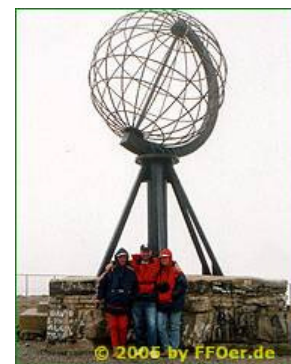
auf dem Nordkapp